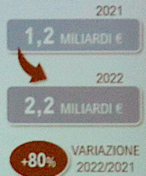
MAIS ITALIA: IMPORT VALORE