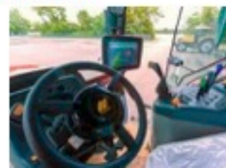
Volante Elettrico AES35