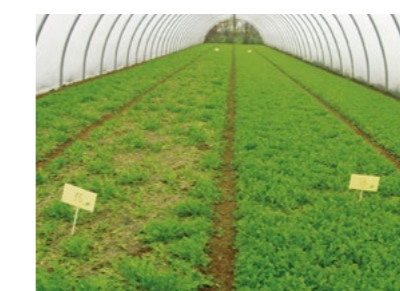
Testimone Patriot Dry

Coltura: Lattughino in serra Patologia bersaglio: Sclerotinia sclerotiorum