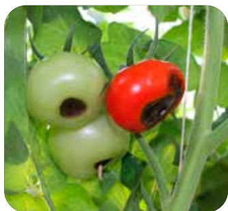
Carenza di CALCIO su pomodoro

La Linea AXI-FLOW è stata messa a punto per prevenire e curare con la massima efficacia e velocità le principali fitopatie da meso e microelementi.