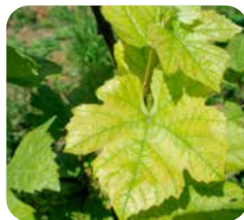
Carenza MICROELEMENTI multipla su vite