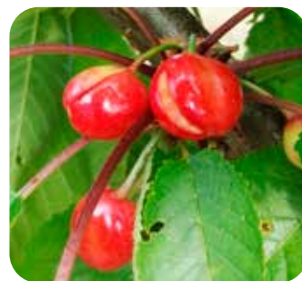
Carenza di CALCIO su ciliegio

La Linea AXI-FLOW è stata sviluppata dall'ufficio SVILUPPO e INNOVAZIONE SCAM: