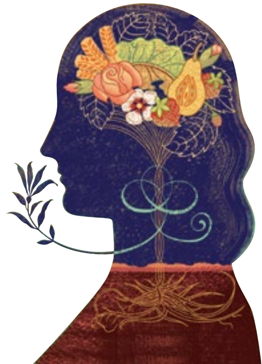
ILLUSTRAZIONE DI ANNA E ELENA BALEUSSO | STAMPA SU CARTA RICICLATA CERTIFICATA FSC