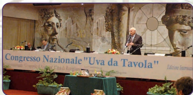
Segreteria organizzativa presso Grand'Hotel d'Aragona

Le manifestazioni si concluderanno alle ore 22,00 circa con il tradizionale buffet