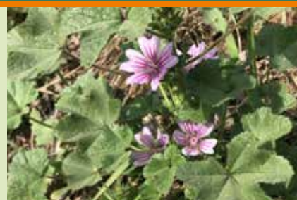
Malva ( Malva sylvestris )