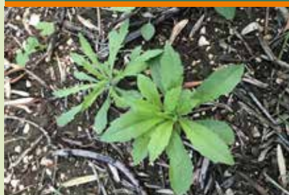
Coniza/Erigeron ( Coniza spp. )