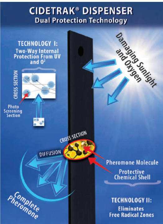
CURVA DI RILASCIO DEL CODLEMONE DI CIDETRAK CM MESO